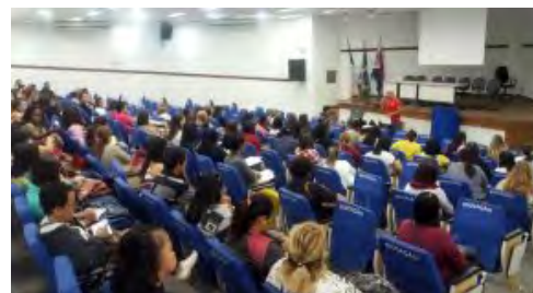
Assembleia em Vila Velha, 2014