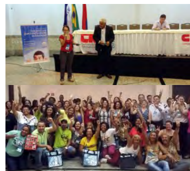
Seminário Estadual de Funcionários/as da Educação, 2015