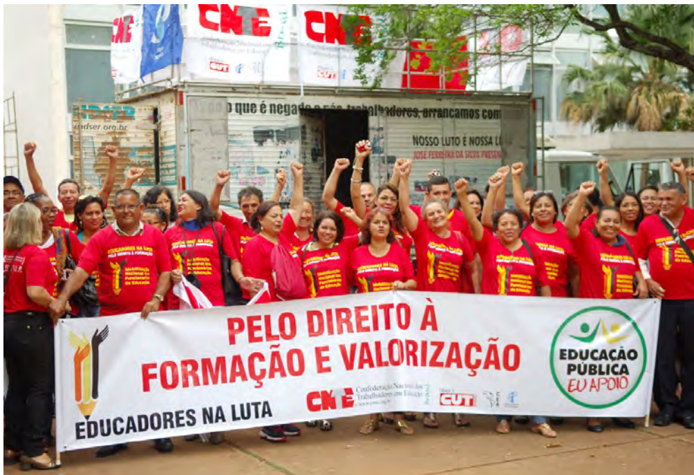
Mobilização reúne centenas de funcionários da Educação em Brasília, 2013