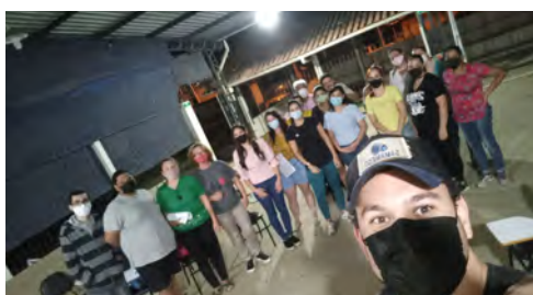
Reunião com os Funcionários de Venda Nova do Imigrante