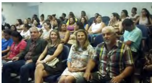
Aula Inaugural do Profuncionário, 2015 – Cursos Técnicos na modalidade Educação à Distância